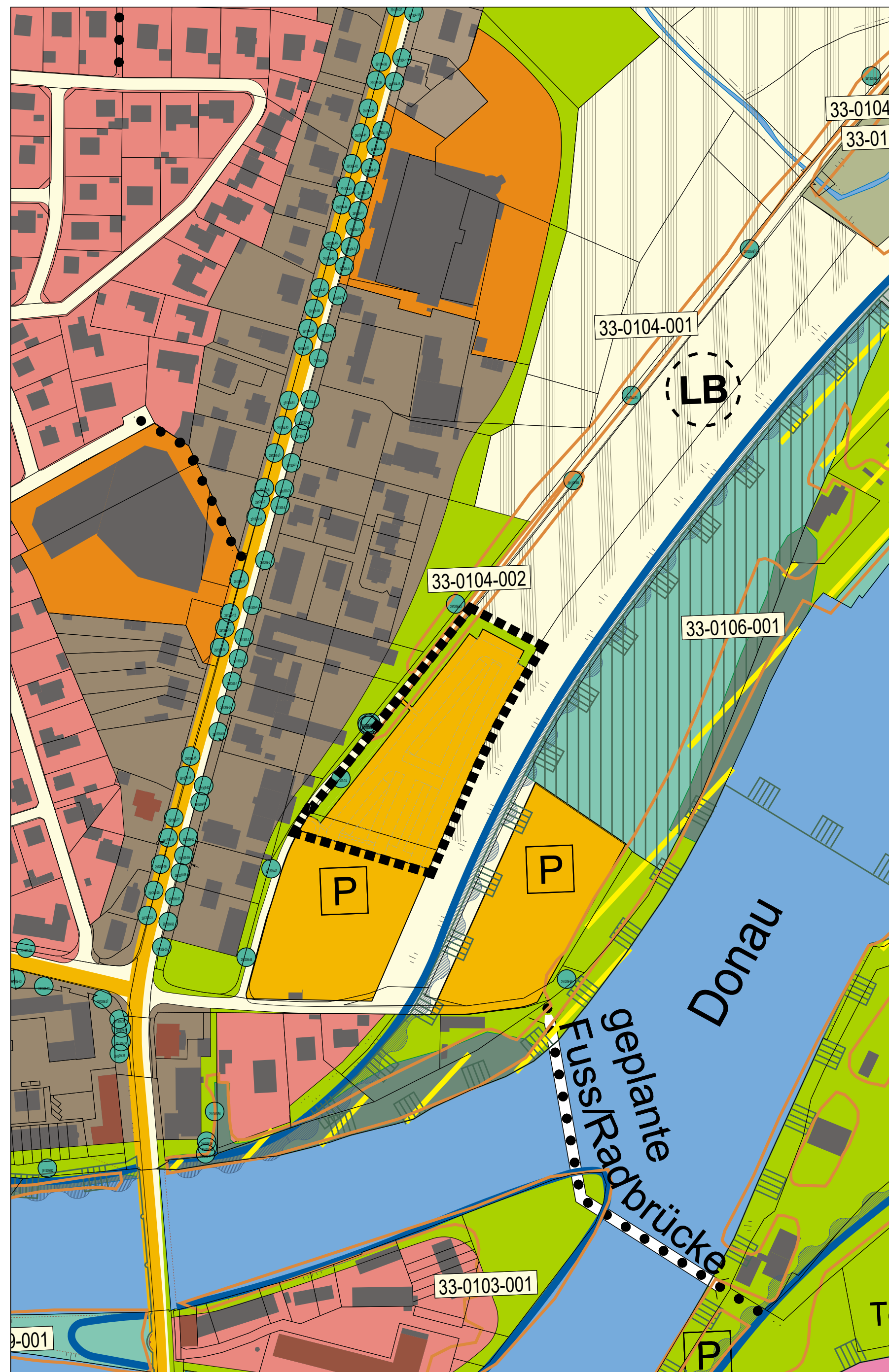
Flächennutzungsplanänderung M = 1 : 2.000