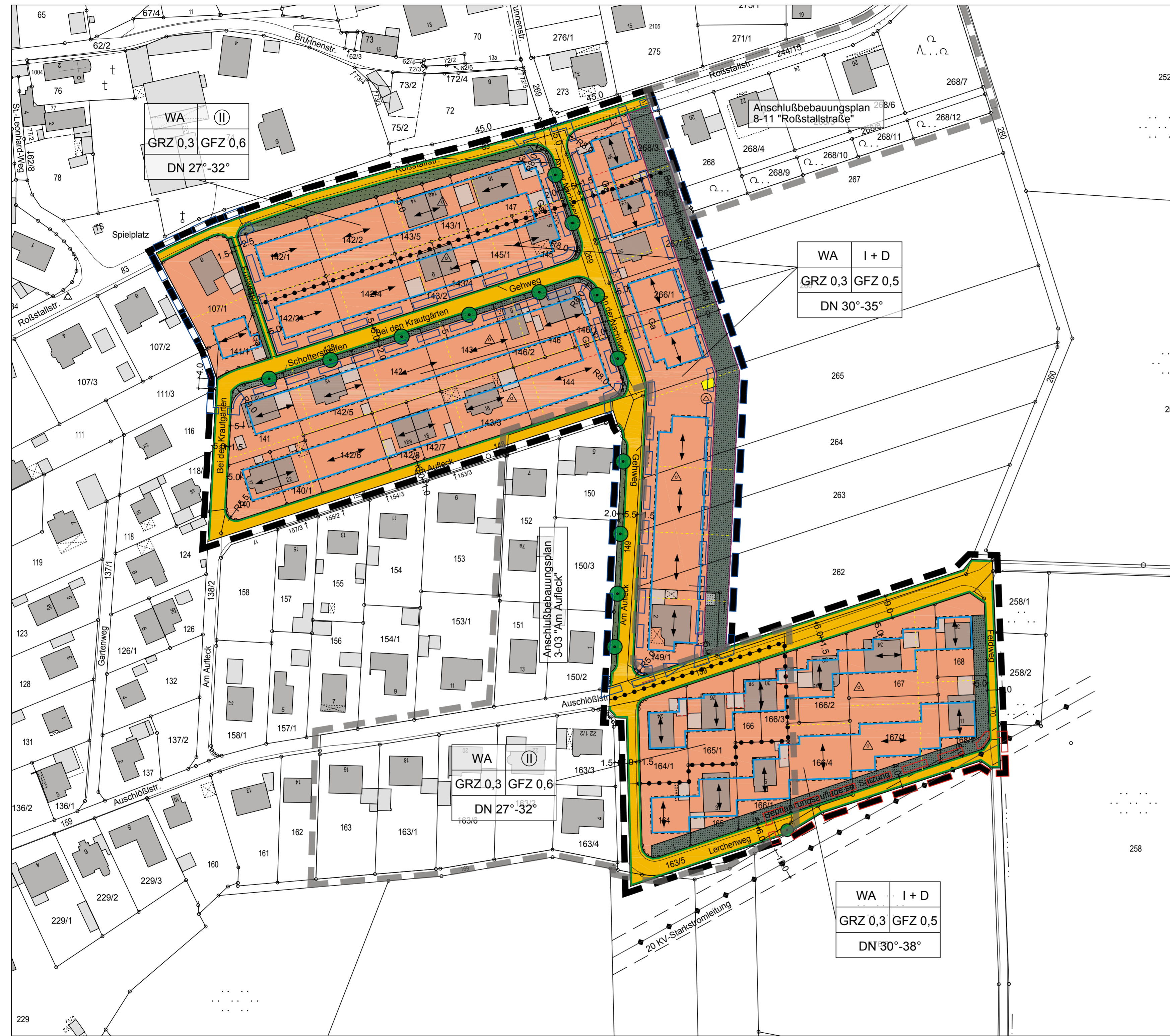
Bebauungsplan Nr. 3-02 "Laisacker II"