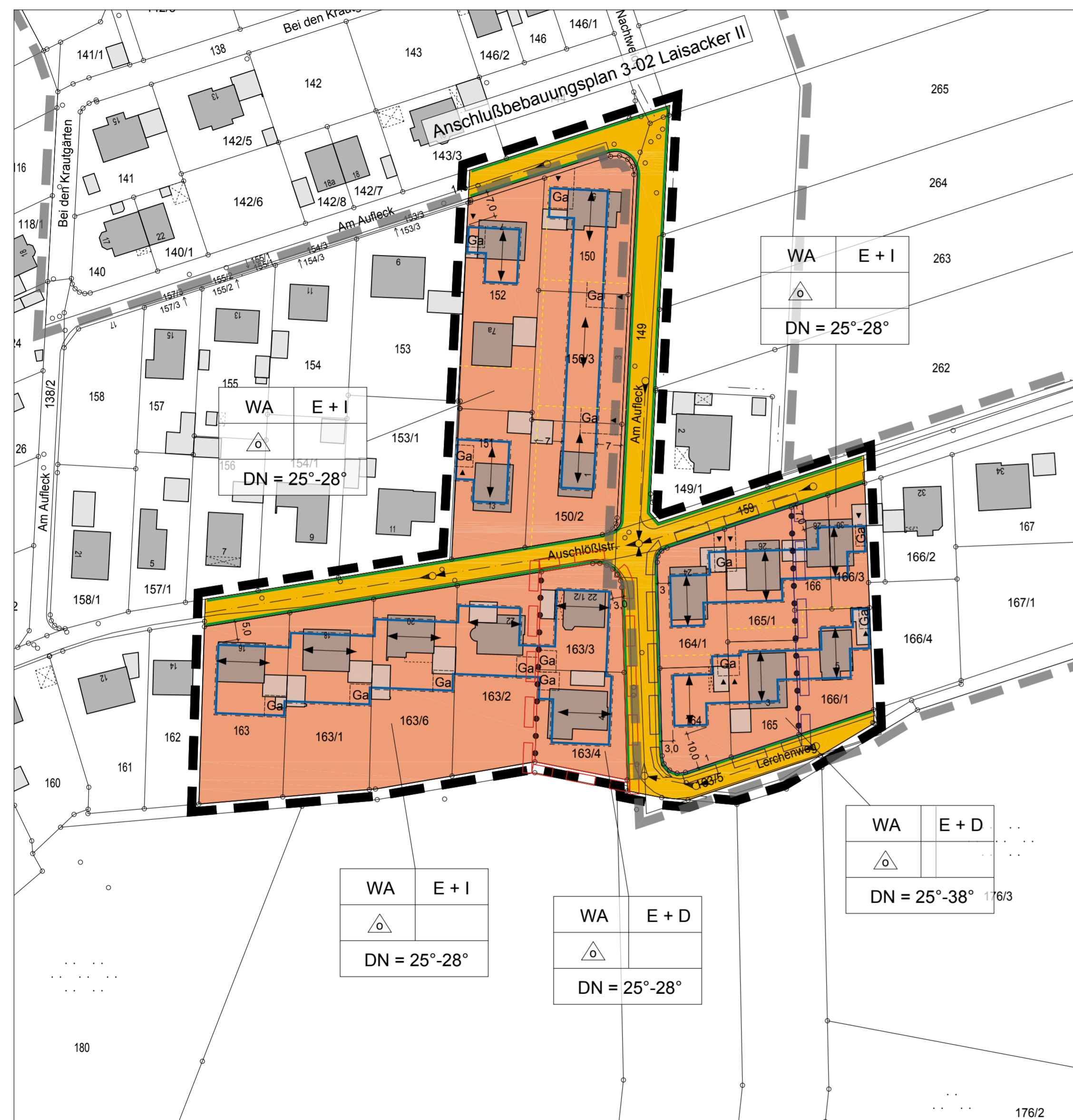
Bebauungsplan Nr. 3-03 " Am Aufleck"