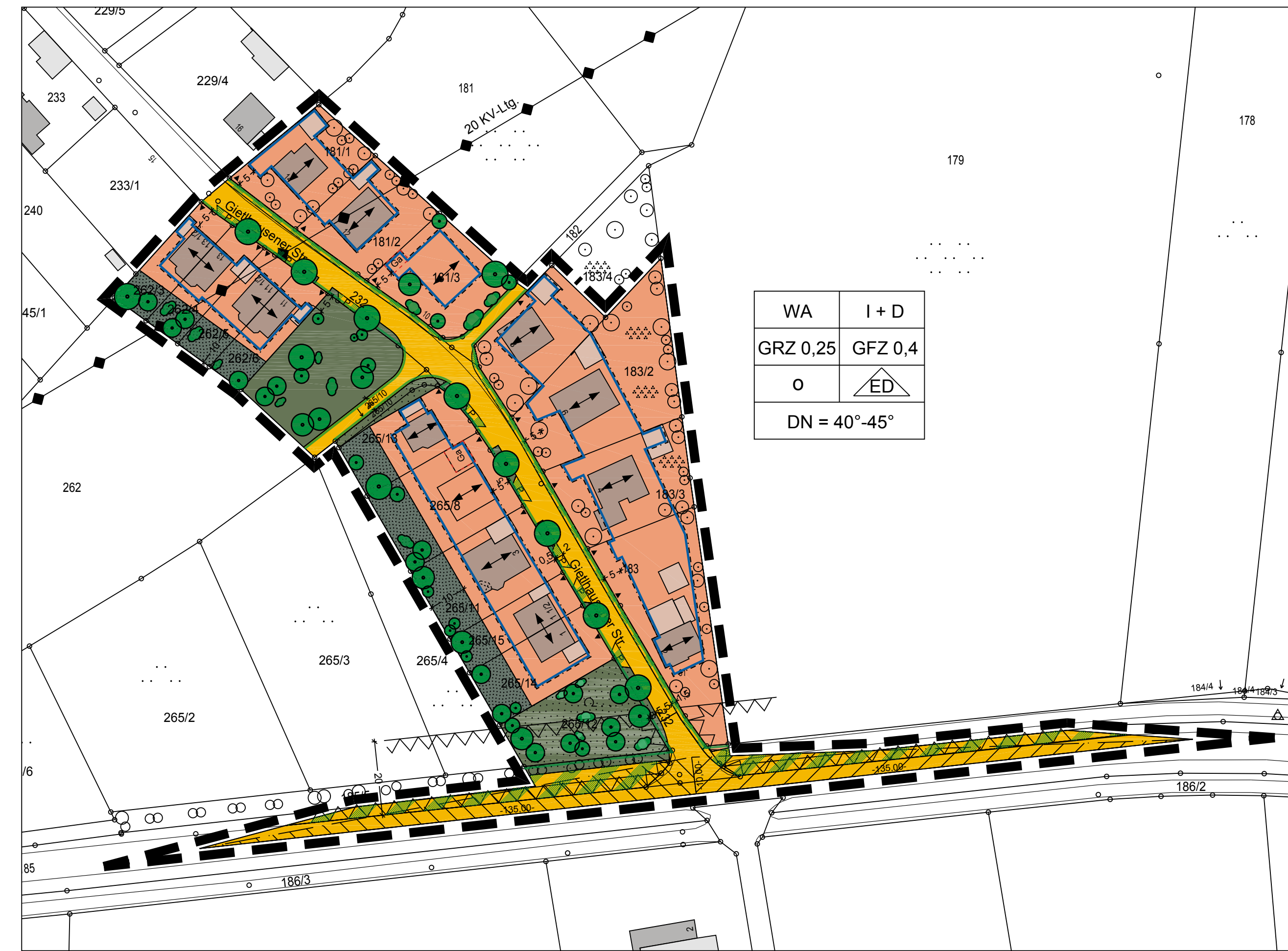
Bebauungsplan Nr. 3 - 04 "Gietlhausener Str."