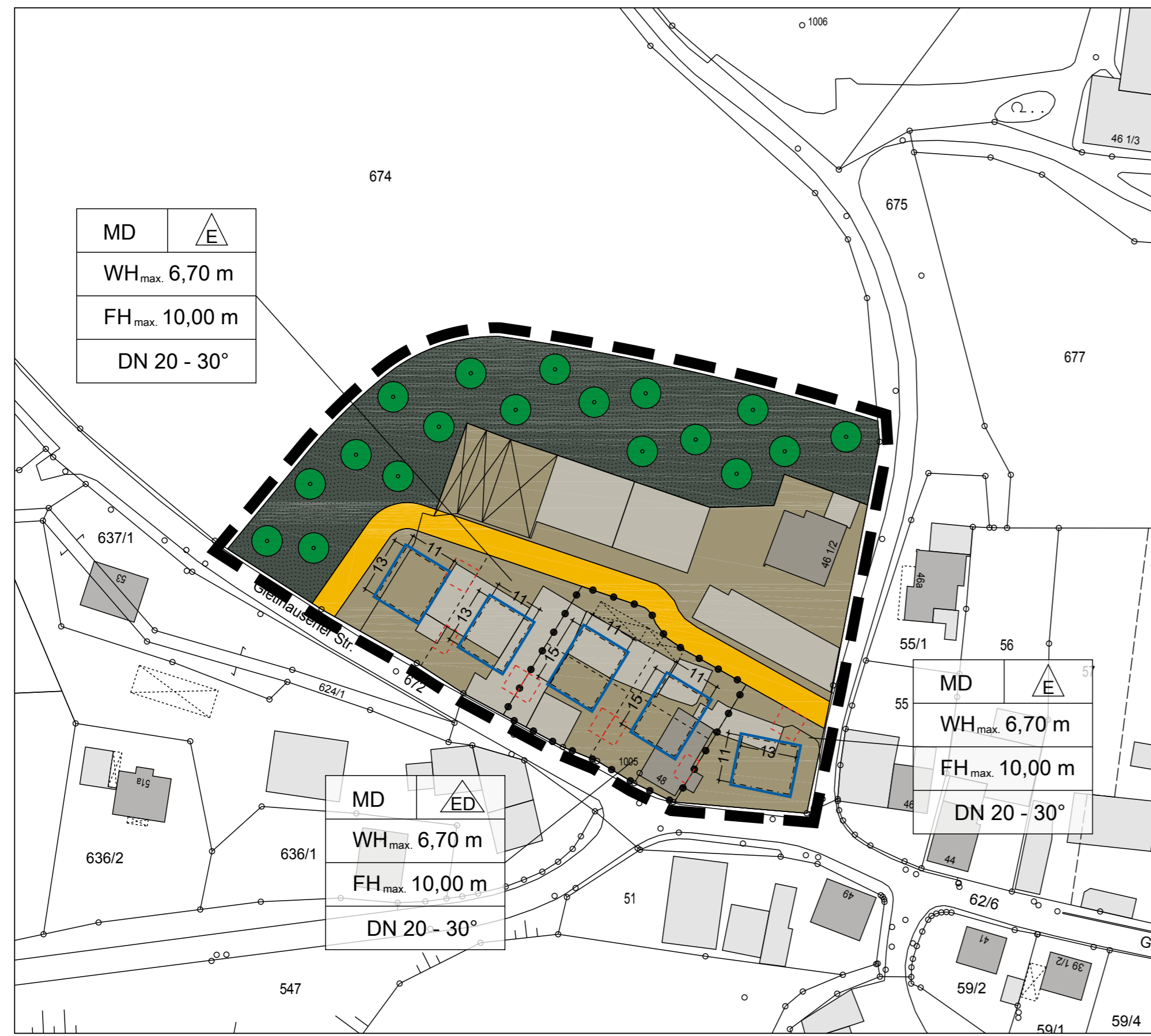
Städtebaulicher Vertrag "V3-03 Gietlhausener Straße" M 1 : 1.000