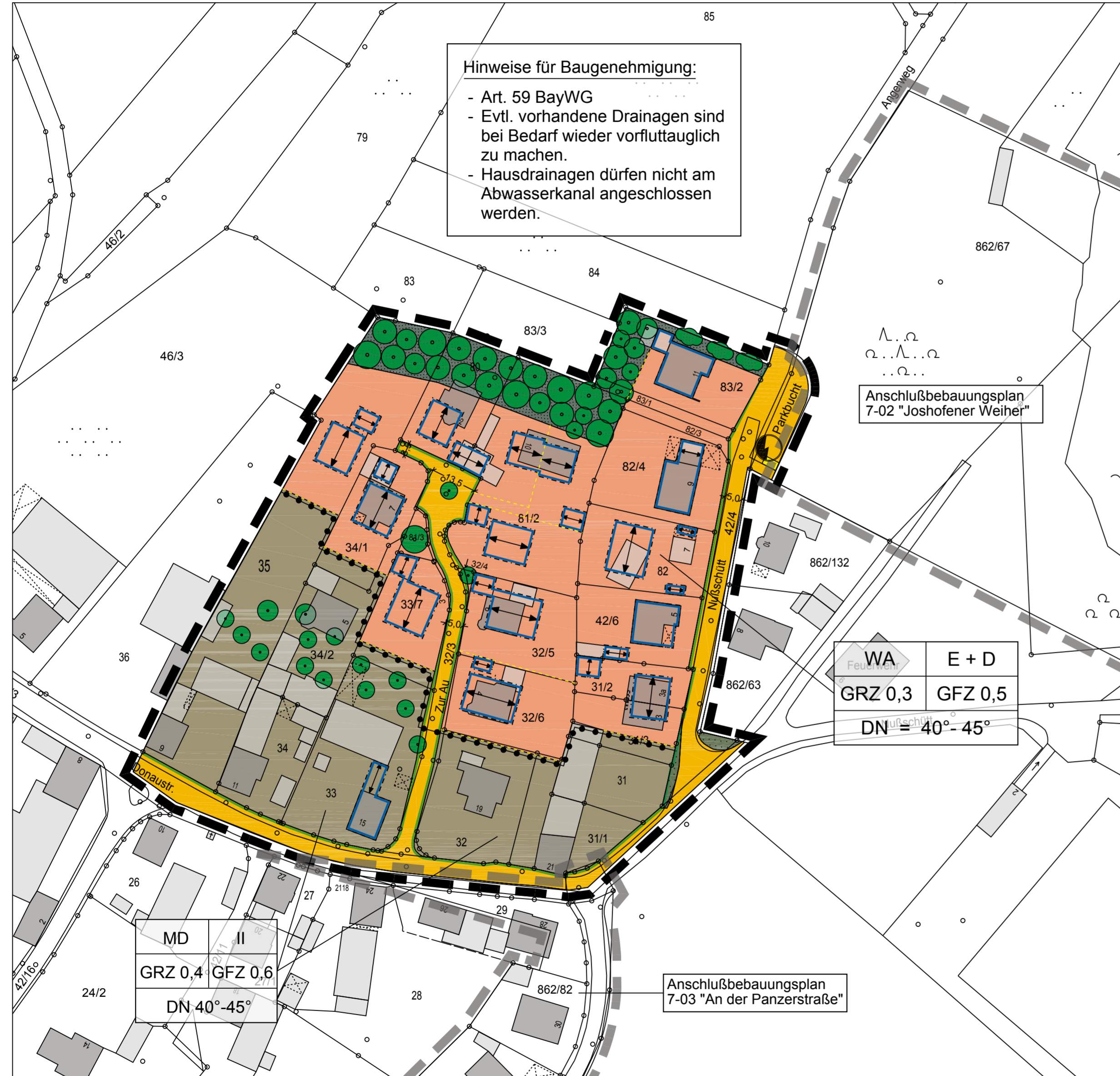
Bebauungsplan Nr. 7-01 "Joshofen II"

Hinweise für Baugenehmigung: - Art. 59 BayWG - Evtl. vorhandene Drainagen sind bei Bedarf wieder vorfluttauglich zu machen. - Hausdrainagen dürfen nicht am Abwasserkanal angeschlossen werden.