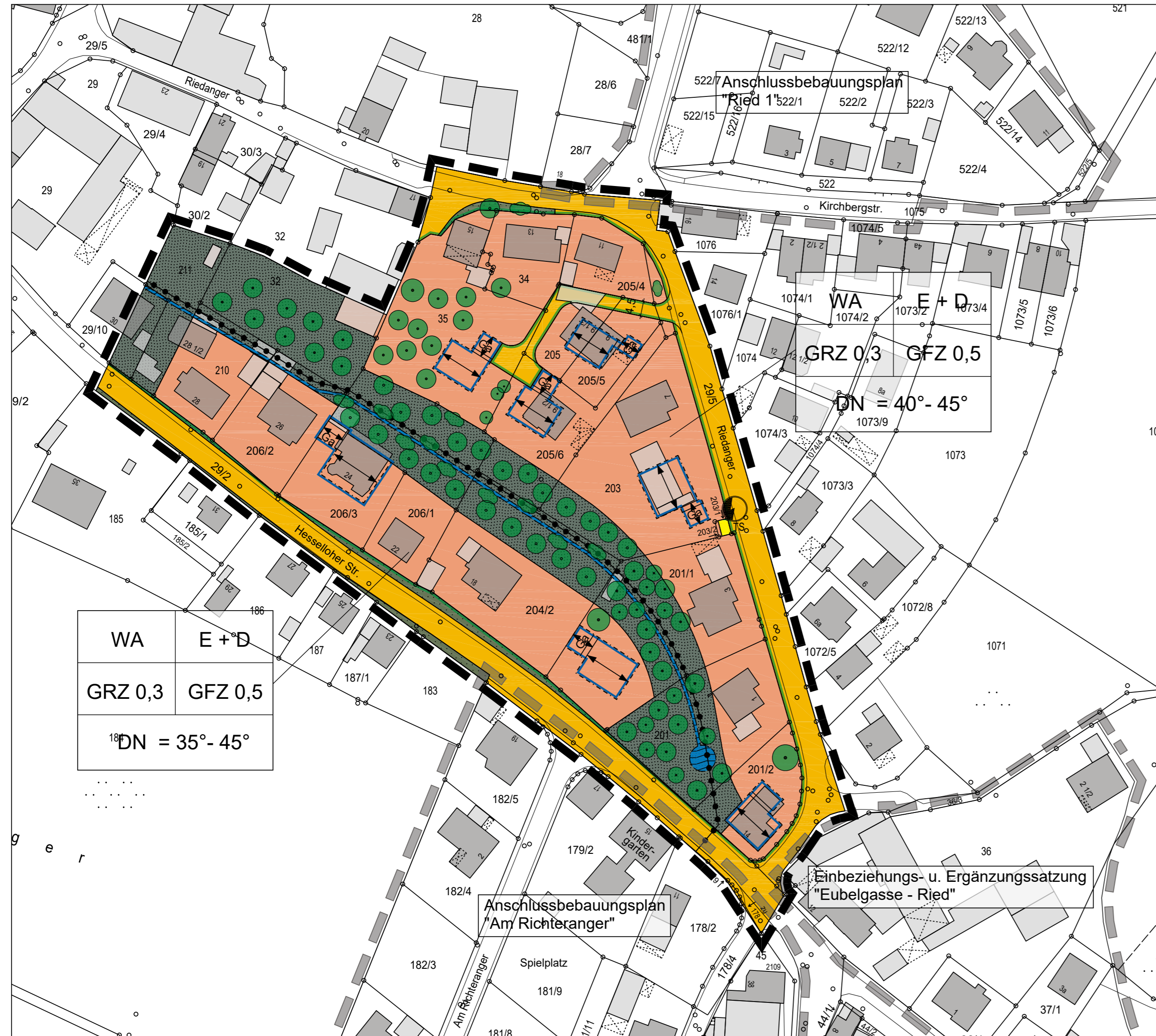
Bebauungsplan Nr. 8-08 "Riedanger"